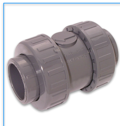
VALVOLE DI FONDO