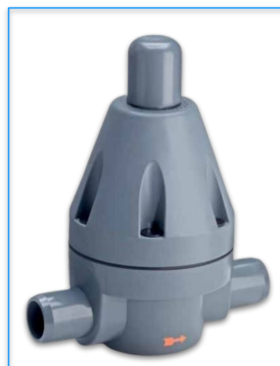
VALVOLE DI SICUREZZA