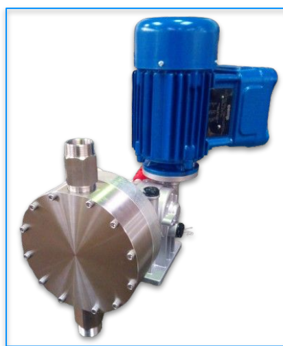
VERSIONE AISI 316