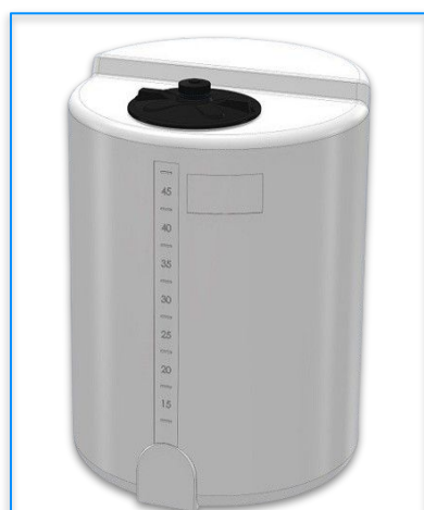
SERBATOI DI DOSAGGIO