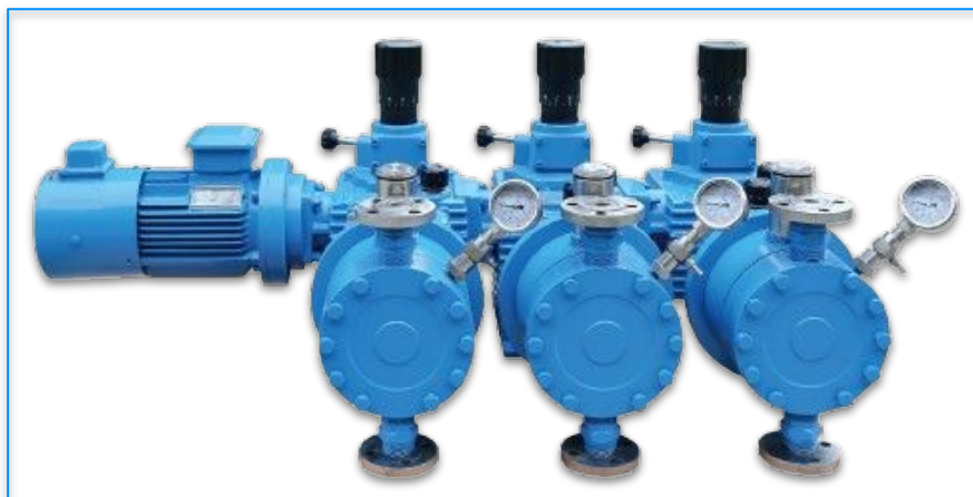
3FRMSXAA MEMBRANA DOPPIA