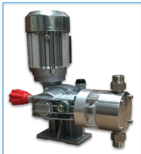
VERSIONE AISI 316